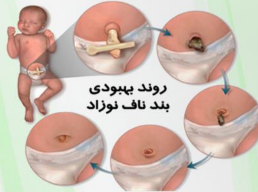
روند بهبودی بند ناف نوزاد

بند ناف معمولاً ۳ روز مرطوب باقی می ماند و قسمت بالایی آن شروع به خشک شدن میکند و در روز هفتم تا دهم تولد نوزاد می افتد اما اگر این مدت طولانی تر نیز گردید نگران نبوده و برای افتادن بند ناف عجله نداشته باشید.